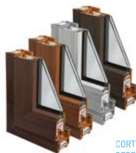
CORTE DE PERFIL

El foliado de los perfiles podrá ser total (totalmente foliado incluido el interior del perfil) o mixto (Posibilidad de foliar en dos colores distintos de acuerdo a las exigencias de diseño)