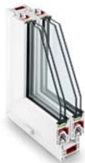
CORTE DE PERFIL

Sistema de perfiles para ventanas corredizas. Profundidad en 60 mm. Sistema básico de 3 cámaras y una profundidad constructiva de 60 mm.