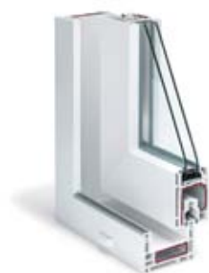
CORTE DE PERFIL

Sistema de perfiles para ventanas corredizas en grandes acristalamientos. Sistema básico de 3 cámaras y una profundidad constructiva de 86 mm