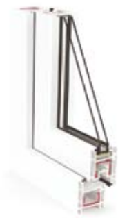
CORTE DE PERFIL

Sistema de perfiles para ventanas y puertas de apertura interior o exterior. Profundidad constructiva de 60 mm.